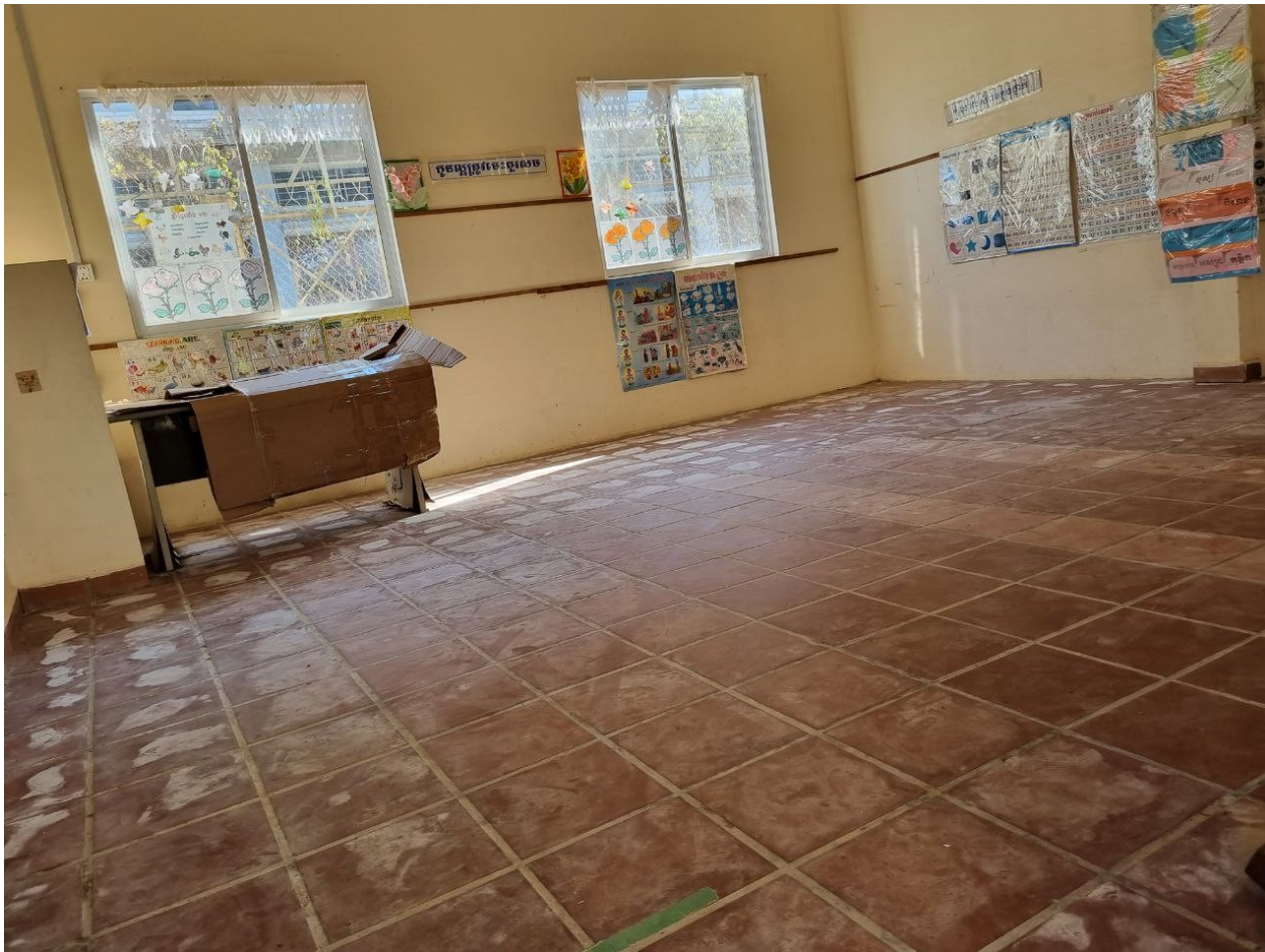
Figure 2: Dieser Klassenraum ist durch Wasser total beschädigt und diesen Schaden ist noch nicht behoben.

Da die wirtschaftliche Situation in Kambodscha sich nach Covid 19 Zeit weiter verschlechtert hat, die Bevölkerungsbewegung vom Land in die Stadt setzt sich weiter fort. Der Bedarf an Kindergartenplätze in der Stadt bleibt wie zu vor groß. Im Kindergartenjahr 2023 haben 89 Kinder (Mädchen 37) zwischen 3 und unter 6 Jahre alt Kindergarten SOMERSAULT besucht.