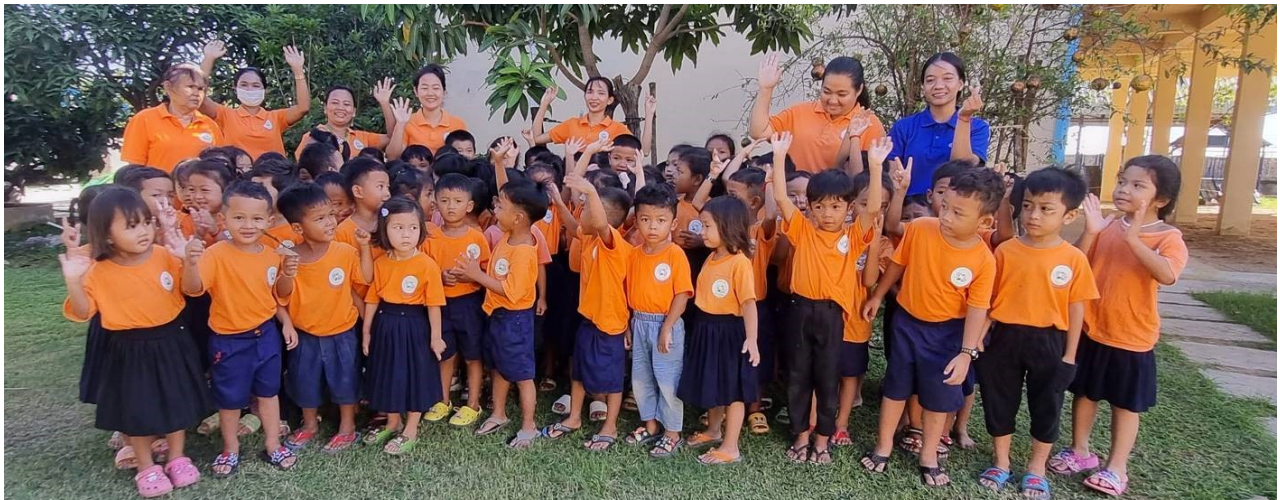
Figure 4: 89 Kinder sind gemeldet, durchschnitt kommen die Kinder knapp über 70 pro Tag