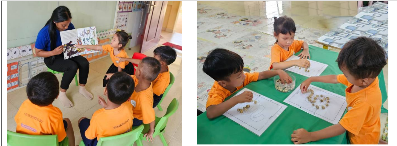
Figure 8: die erhalten im Klassenraum und im Freien verschiedene Unterrichtsangebote um gut für den Schulbesuch gut vorzubereiten