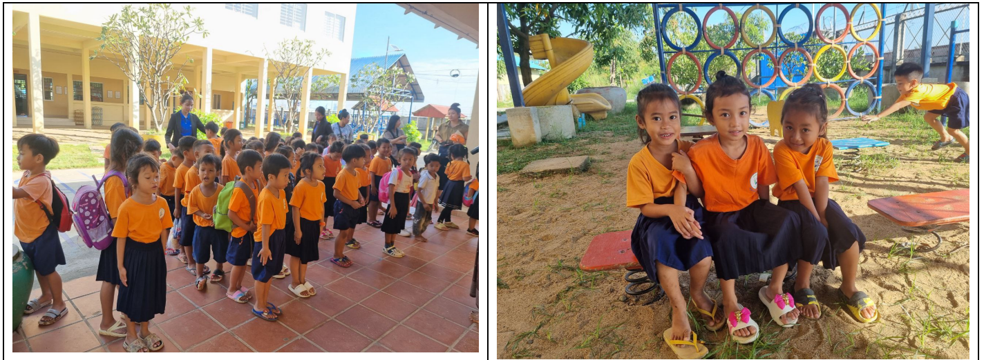
Figure 11: Bilder am 4 Dezember 2023, erste Kindergartentag

Kindergarten SOMERSAULT 2023/2024 wurde am 4. 12. 2023 für die Kinder geöffnet. An dem ersten Tag haben sich 83 Kinder Kindergarten SOMERSAULT gemeldet, davon 50 Kinder kommen mit ihrer Familie aus dem Land und 15 Kinder aus der Familie mit unter Armutsgrenze.