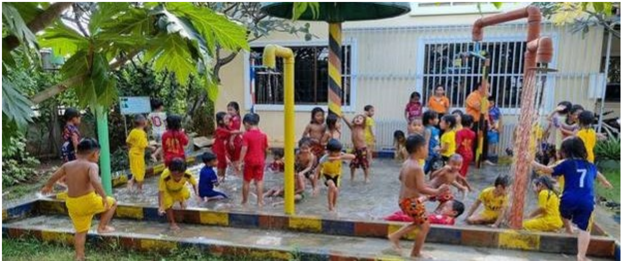
Figure 5: Dieses Angebot ist einmal in der Woche..