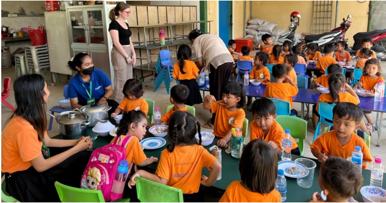
Figure 7: die Kinder bekommen Mittagessen bevor sie zum Mittagschlaf im COMPED HOME gehen