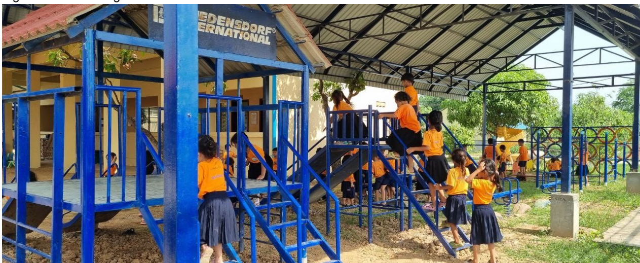
Figure 6: Kind zu sein für die Kinder ist ein Ziel des Kindergartens