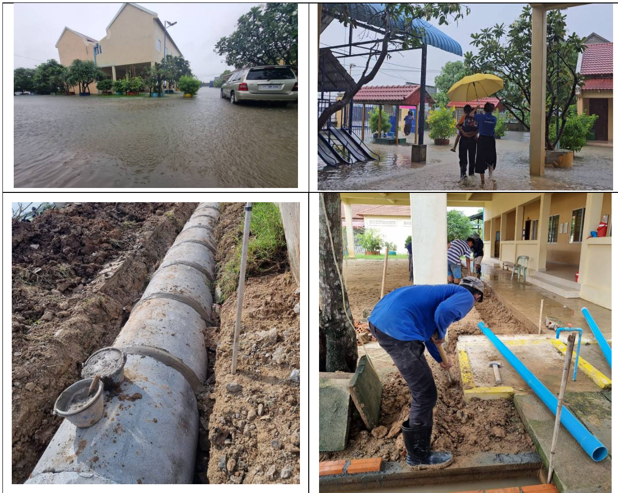
Figure 1: Neben Reparatur und Trotz Regen lief Kindergarten SOMERSAULT im CH im ganzen Jahr

Ein Klassenraum für Hortkinder ist stark beschädigt, und ist noch nicht repariert bzw. saniert.