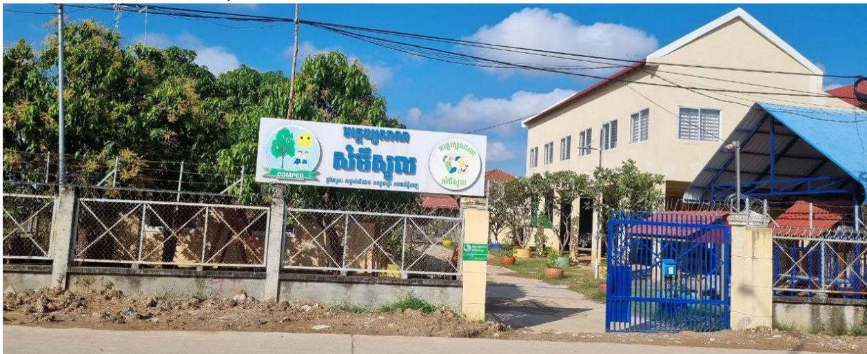
Figure 3: Kindergarten SOMERSAULT befindet sich in Village Rolous, Sangkat Choeung Ek, Khan Dangkor, Phnom Penh